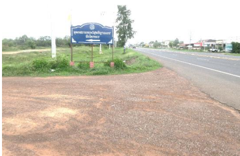
ภาพประกอบที่ 4 แสดงเส้นทางและป้ายบอกทางเข้าพุทธสถานวิสุทธิญาณเถร เป็นอีกเส้นทางที่เข้าไปด้านหลัง สภาพถนนเป็นลูกรังประมาณ 700 เมตร ถ่ายภาพเมื่อวันที่ 16 เมษายน 2565