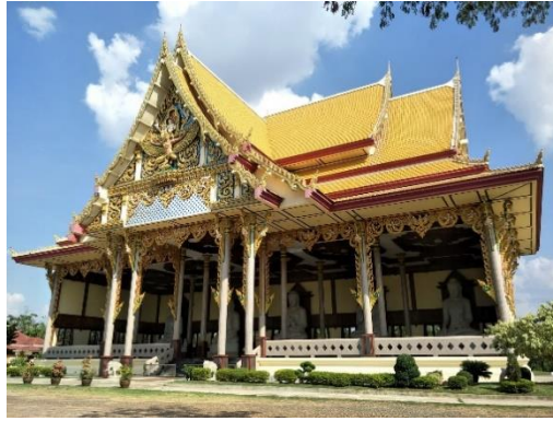
ภาพประกอบที่ 2 พระพุทธปฏิมาพระพุทธรเจ้า 5 พระองค์หินอ่อนขนาดใหญ่ในมณฑป ถ่ายภาพเมื่อวันที่ 16 เมษายน 2565